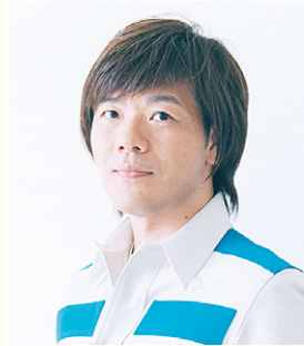
平野啓一郎 (小説家) HIRANO Keiichiro

芥川賞作家・平野啓一郎のベストセラー小説で、2019年に福山雅治・石田ゆり子主演で映画化もされた『マチネの終わりに』。作中にも登場したクラシックギターの演奏とトークで作品の魅力を語り合います。