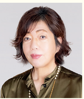
林真理子 (作家) HAYASHI Mariko

音楽に造詣が深く、オペラ好きで知られる作家・林真理子のセレクトによる、珠玉のオペラ・アリアと魅惑のクロストーク。歌手とピアニストが奏でる極上の「音楽」と、繰り広げられるトークによる「言葉」で、オペラの魅力に触れるステージをご堪能ください。