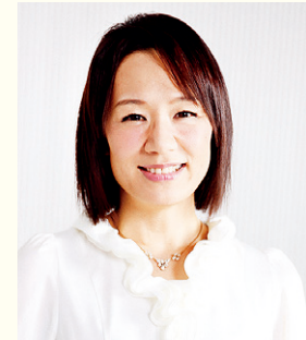
宮下奈都 (作家) MIYASHITA Natsu

2016年に本屋大賞を受賞、映画化もされ話題となった、若き調律師の物語『羊と鋼の森』。ピアノの音に魅せられた作家×世界的若手ピアニスト×カリスマ調律師が、様々な視点で作品の魅力に迫ります。