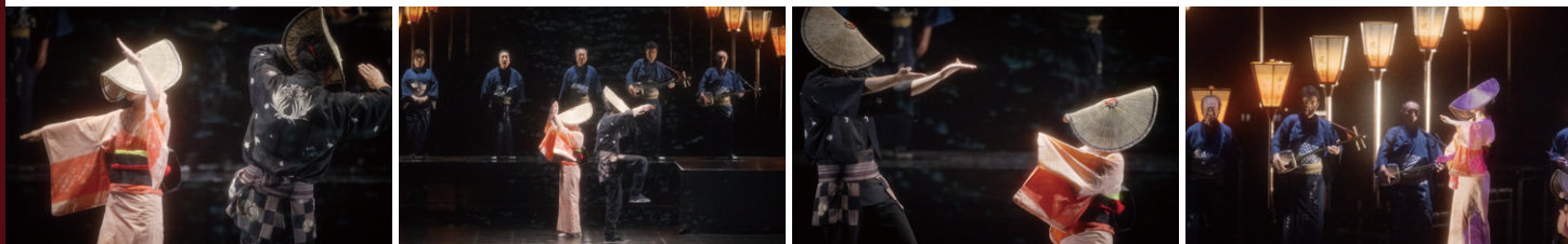
舞台写真：2025年開催より

歌詞を投影し、映像や照明、音響とともに実演します。唄と踊り、そして言葉が重なり合い、劇場ならではの幻想的な「おわら」の世界が広がります。