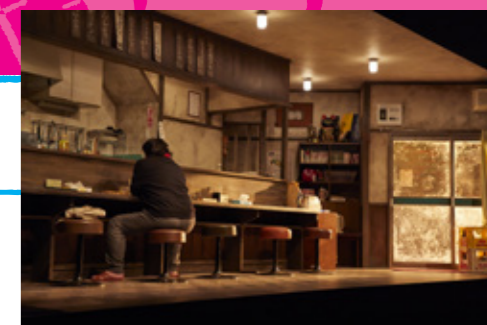
ダークマスター 2019 TOYAMA

このプロジェクトの大きな特徴ともいえるのが、市民による舞台美術製作。素人がつくりあげたとは思えない精巧な舞台美術は、第1弾、第2弾ともに観客を大いに驚かせた。第3弾となる今回も、高校生から70代まで年齢も職業も多様な35名が毎週末に集まって製作中! 美術家・稲田美智子による超リアルなセットが中ホールに立ち上がる。