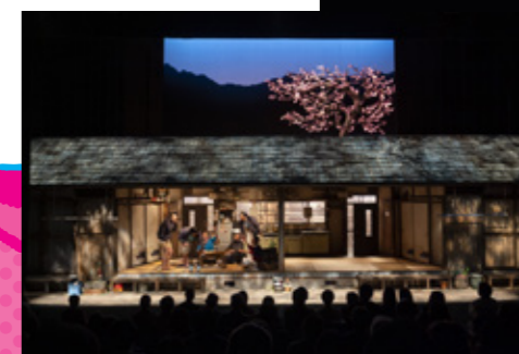
笑顔の砦 '20 帰郷