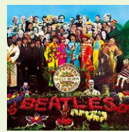
VOL.3 「中期ビートルズの魅力2」で語ります

ひげを生やし、豪華けんらんアルバム「サージャント・ペパ」発表。世界各国リレー宇宙中継で英国を代表し、新曲「愛こそはすべて」発表。TV特番「マジカル・ミステリーツアー」制作。