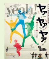
VOL.1 「初期ビートルズの魅力」で語ります

全米チャート1位〜5位を独占し、遂に世界の頂上に。主演映画第1作「ビートルズがやって来る ヤア! ヤア! ヤア!」公開。