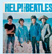
VOL.2 「中期ビートルズの魅力1」で語ります

主演映画第2作「HELP! 4人はアイドル」公開。夏の全米ツアーは、各地で史上初の野球場コンサートを敢行(全て売り切れ)。