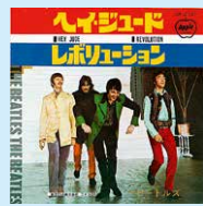
VOL.4 「後期ビートルズの魅力1」で語ります

瞑想修行のためインドへ。自らのレコード会社「アップル」を設立。第1弾シングル「ヘイ・ジュード」、第1弾アルバム「ザ・ビートルズ(通称ホワイト・アルバム)」大ヒット。