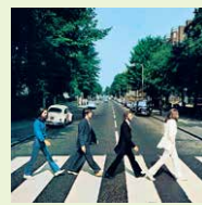
VOL.6 「後期ビートルズの魅力2」で語ります

原点回帰を目指す「ゲットバック・セッション」敢行。珠玉のアルバム「アビー・ロード」発表。