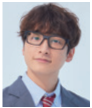
有馬公生 (Wキャスト) 小関裕太