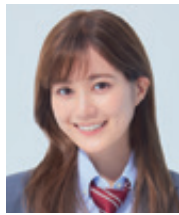
宮園かをり 生田絵梨花