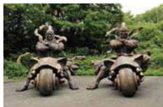
象駆輪 金剛力士座像

1972年生。上市町在住。東京モード学園在学中に、ファッションクリエイター新人賞国際コンクール日本代表、第10回ルミネファッション大賞を受賞。2005年より上市町を拠点に絵画制作活動を開始。これまで第83回春陽展奨励賞、第1回越中アートフェスタ優秀賞・北日本新聞社賞、越中アートフェスタ2011優秀賞・北日本新聞社賞を受賞。2007年より文芸誌「弦」の装画を制作。数々の個展、グループ展に出演。