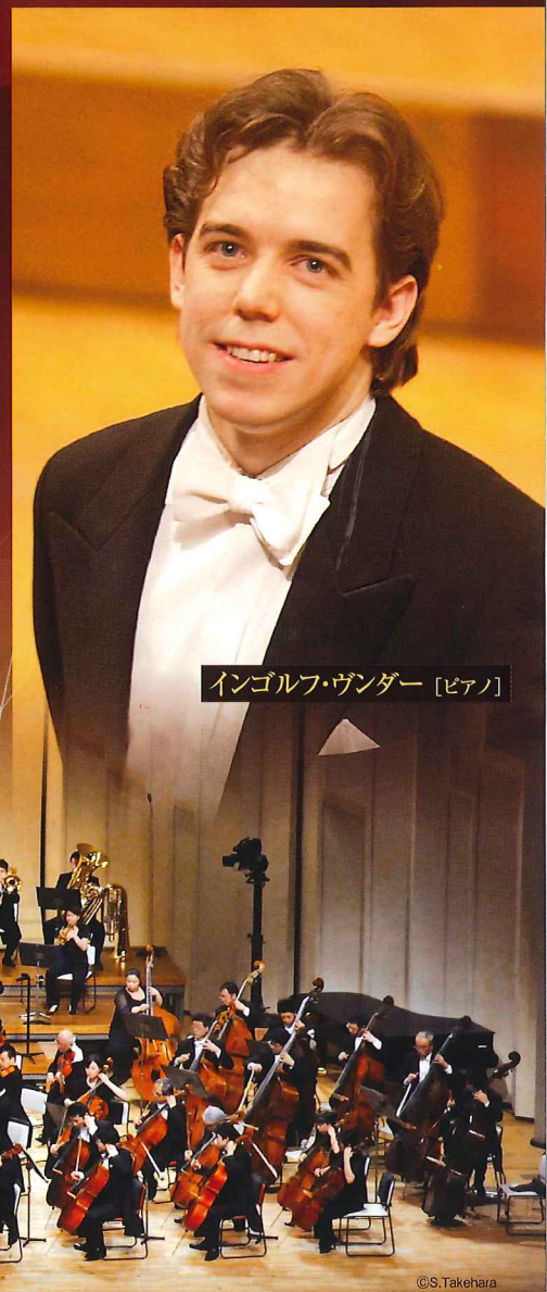
インゴルフ・ヴァンダー [ピアノ]