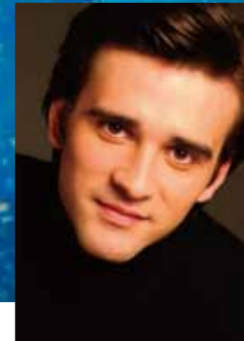
ルスラン・スクヴォルツォフ (ポリショイ・バレエ団 プリンシパル) 岩足