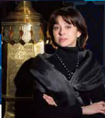
ニーナ・アナニアシヴィリ (ジョージア国立バレエ団 芸術監督) 春日野すがる乙女

主演の美しい舞女「春日野すがる乙女」には、世界的バレリーナとして人気を誇るニーナ・アナニアシヴィリ、パートナーにはポリショイ・バレエ団のプリンシパル、ルスラン・スクヴォルツォフが決定！古代日本が舞台のファンタジー作品への出演は、ニーナにとって新しい挑戦となる注目の舞台です。そして物語の核となる孤高の竜神には、牧阿佐美バレエ団のプリンシパルとして存在感を増す菊地研が登場します。